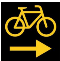
Autorisation d'obliquer à droite pour les cycles

Le signal "Autorisation d'obliquer à droite pour les cycles" (OSR 5.18) permettra aux cyclistes et aux cyclomotoristes d'obliquer à droite, ceci même si le feu est à la phase rouge. La combinaison du feu rouge et de ce signal équivaut alors à un "Cédez le passage" lorsque les usagers autorisés obliqueront à droite.