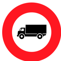
Circulation interdite aux camions (OSR 2.07)

Les signaux "Circulation interdite aux camions" (OSR 2.07) et "Interdiction aux camions de dépasser" (OSR 2.45) concernent dorénavant également les voitures automobiles de travail lourdes (ex. autogrues, épareuses, balayeuses, etc.).