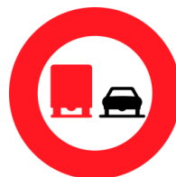
Interdiction aux camions de dépasser (OSR 2.45)

Le signal "Autorisation d'obliquer à droite pour les cycles" (OSR 5.18) permettra aux cyclistes et aux cyclomotoristes d'obliquer à droite, ceci même si le feu est à la phase rouge. La combinaison du feu rouge et de ce signal équivaut alors à un "Cédez le passage" lorsque les usagers autorisés obliqueront à droite.