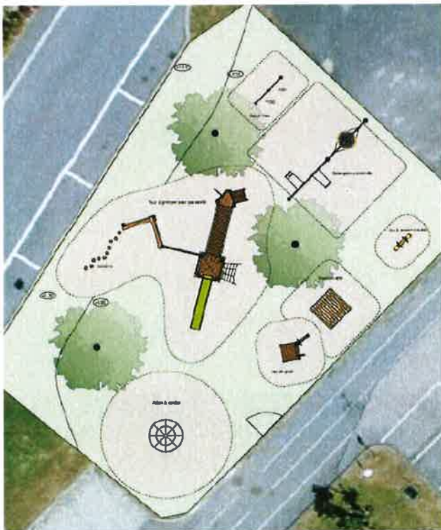
Projection de la place de jeux de L'Isle, parcelle no 313